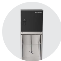
Mélangeurs à desserts glacés