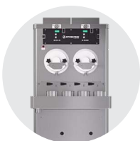
Machines à crème glacée à débit continu