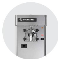
Distributeurs de boissons glacées