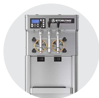
Machines à yaourt glacé et crème glacée

Chez Stoelting, nous sommes fiers de fabriquer des équipements professionnels qui offrent les meilleures expériences en matière de glaces. Découvrez pourquoi nos machines à glace sont aussi robustes et fiables que notre réputation.