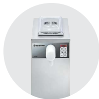
Distributeurs de crème fouettée