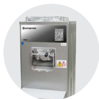
Machines à glace à cuves verticales et débit discontinu