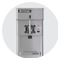
Machines à milk-shake et smoothie