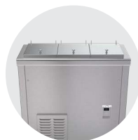
Chariots de stockage réfrigérés